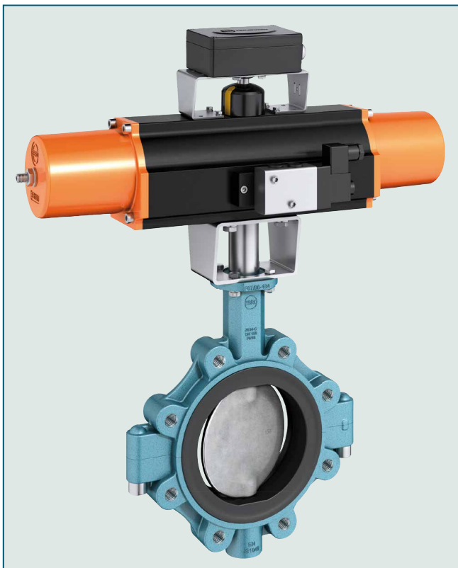
Válvula de mariposa tipo lug para aplicaciones de cierre y regulación, especialmente para la industria química.