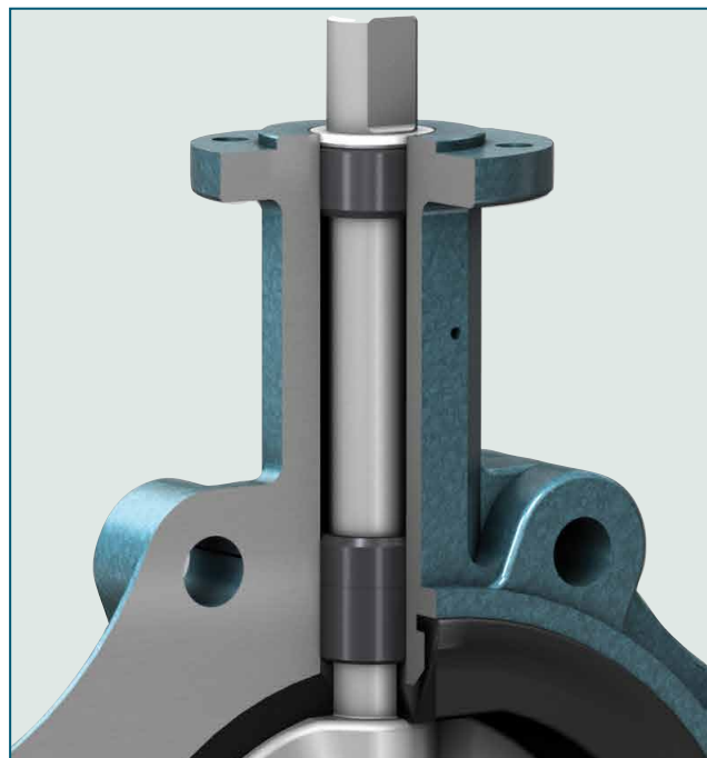
Obturación de seguridad del eje homologada TA-Luft/ VDI 2440, RWTÜV.